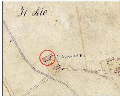
Estratto Catasto 1824: