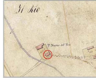
Estratto Catasto 1824: