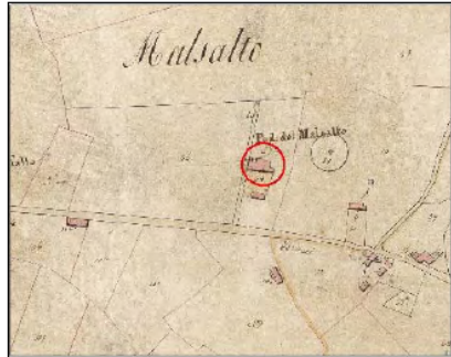
Estratto Catasto 1824: