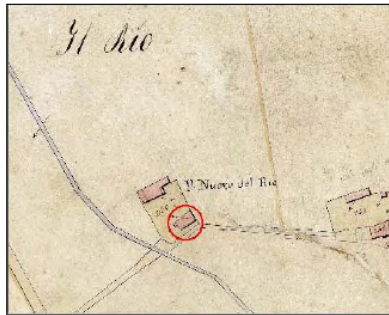
Estratto Catasto 1824: