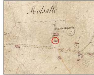
Estratto Catasto 1824: