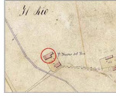
Estratto Catasto 1824: