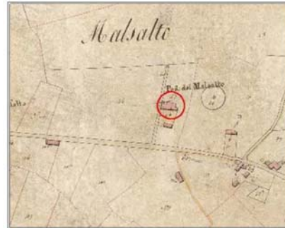
Estratto Catasto 1824: