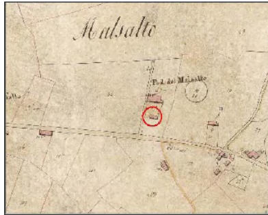
Estratto Catasto 1824: