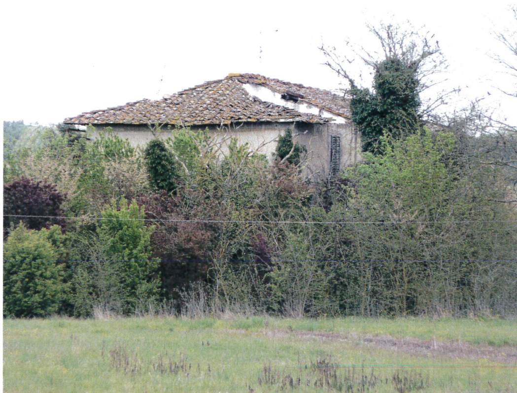
3.Fabbricato Podere Rio verso est