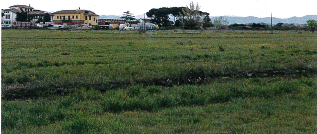
1. Vista del comparto da sud verso nord