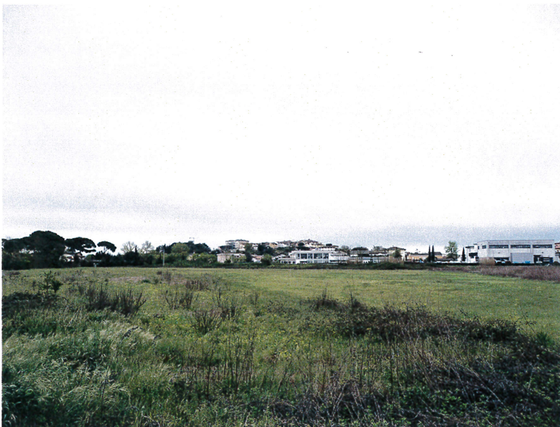
10. Vista da nord verso sud