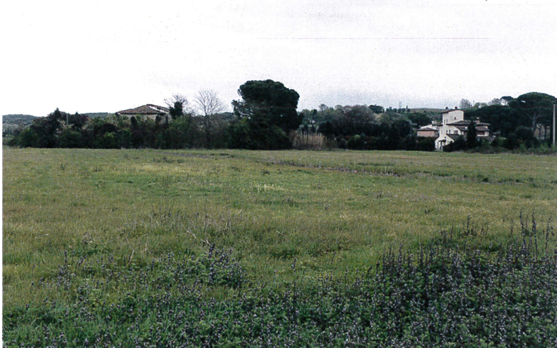
4. Fabbricato Podere Rio verso est nel più vasto contesto