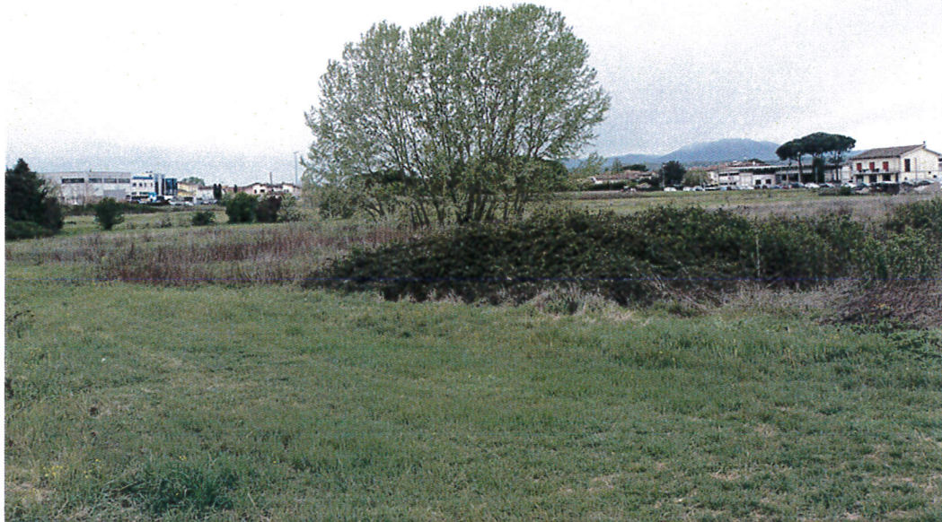
9. Vista da est verso sud / sud ovest