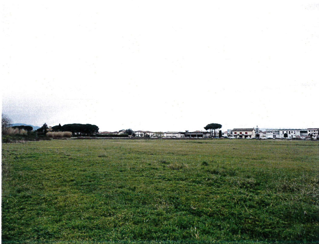
6. Vista del comparto da sud verso ovest