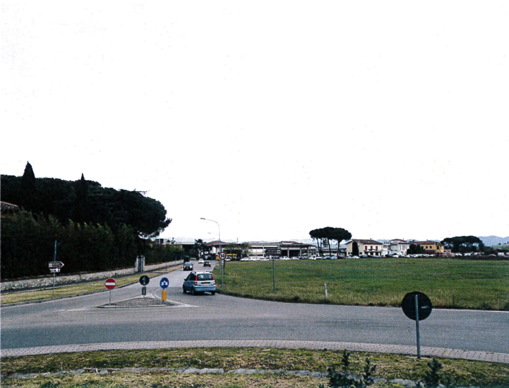
14. Vista dalla rotonda su via Francesca bis verso via di Burello