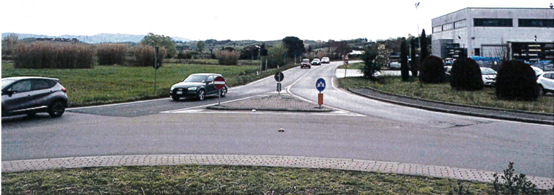
15. Vista dalla rotonda Francesca bis verso est