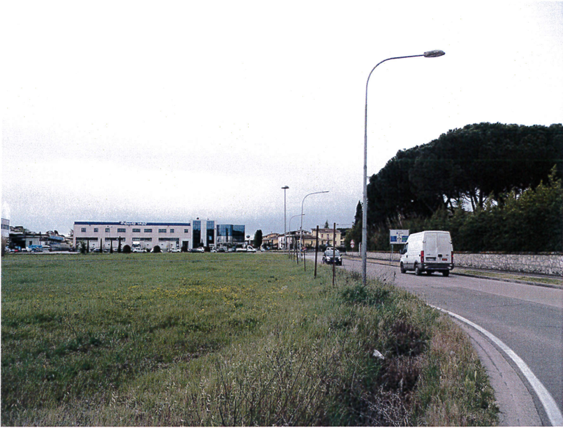
13. Vista da via dei rosai / incrocio via Burello verso sud