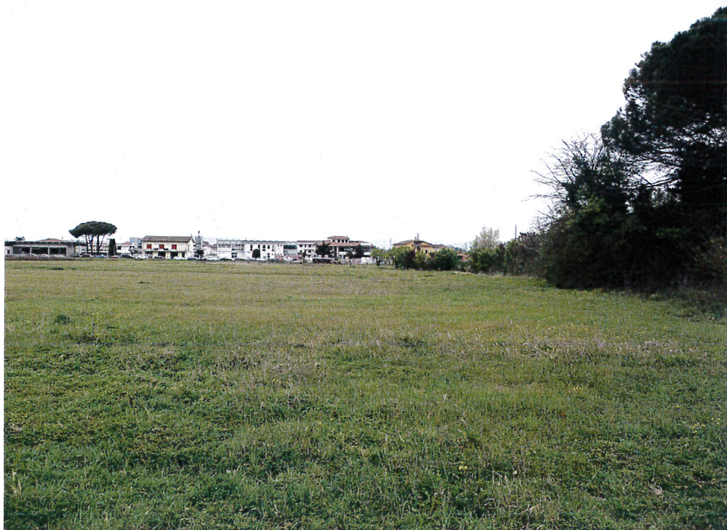
7. Vista del comparto da sud verso ovest