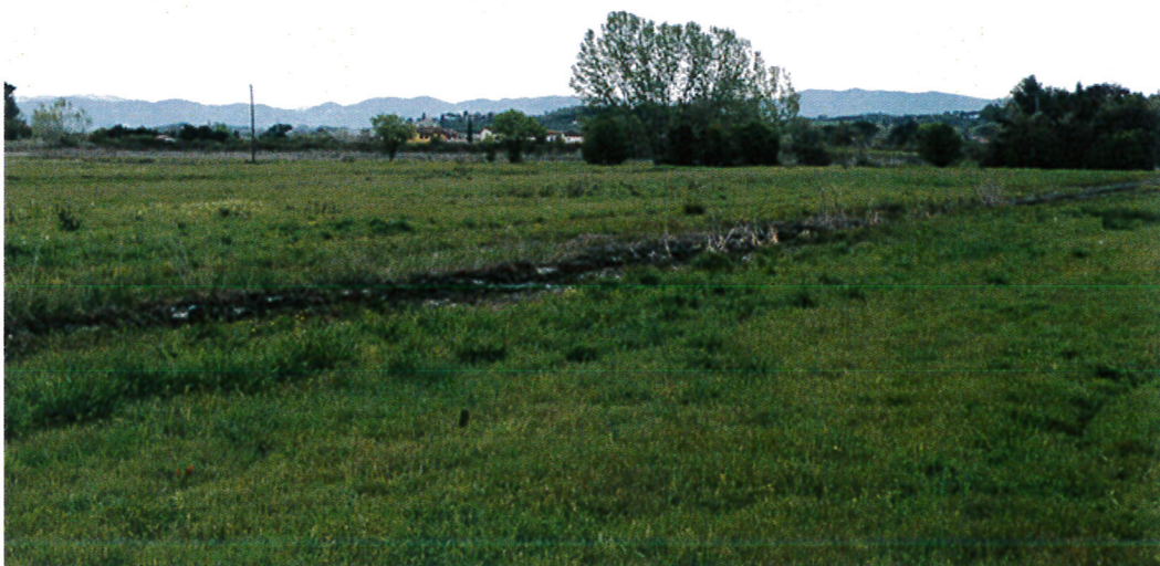
2. Vista del comparto da sud verso ovest