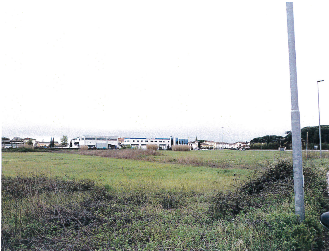
11. Vista da nord verso sud