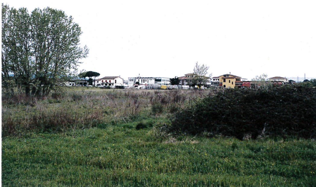
8. Particolare dell'area di V.P. ove è presente la vasca di raccolta delle acque piovane. Foto dall'argine del Rio verso ovest