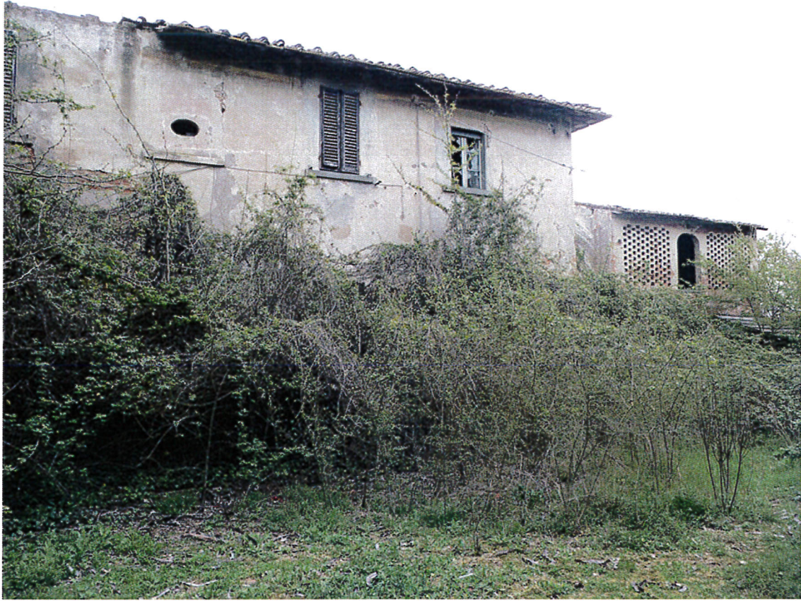
5. Podere Rio particolare del fronte