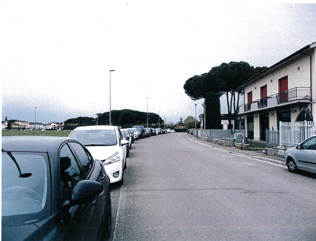
12. Vista da via dei rosai verso ovest